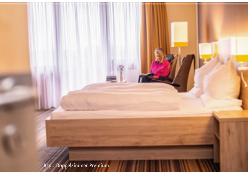
Bsp.: Doppelzimmer Premium