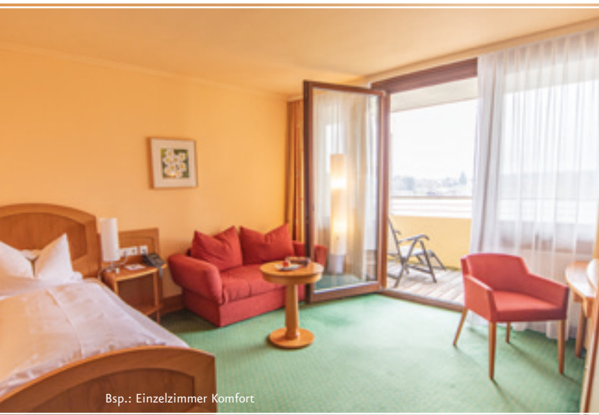
Bsp.: Einzelzimmer Komfort