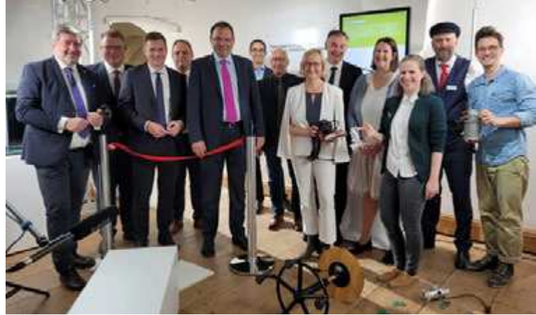
Mitwirkende, Regisseur & Hauptdarsteller, letzte Filmszene