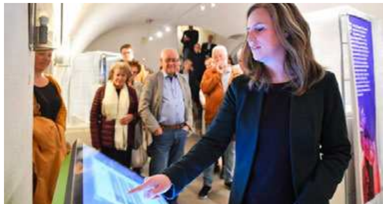
Eröffnung der vorbereitenden partizipativen Ausstellung im Fichtelgebirgsmuseum, 2023