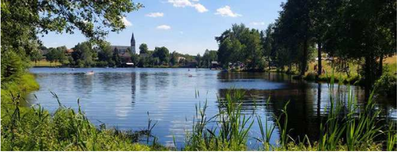
Rund um den Nagler See finden die Kräuterwanderungen statt.