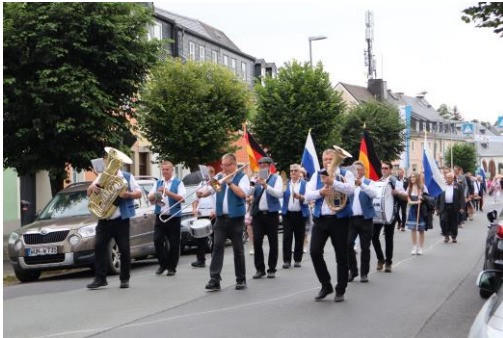
Volks- und Wiesenfest