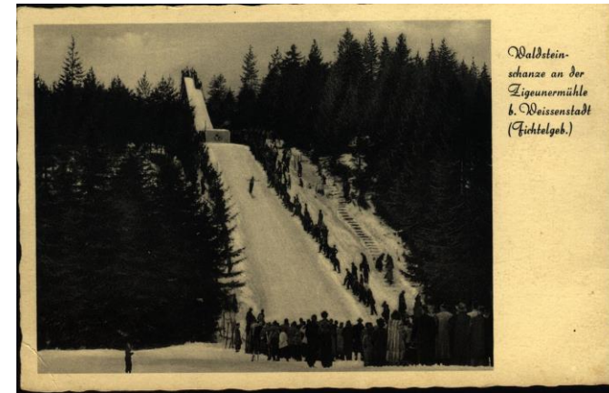
Waldstein- schanze an der Ligounermühle b. Weißenstadt (Fichtelgeb.)