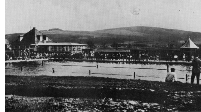
Stadtbad Weißenstadt ungefähr 1930.