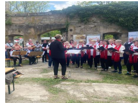
Muttertags-Singen zum Frühlingszauber